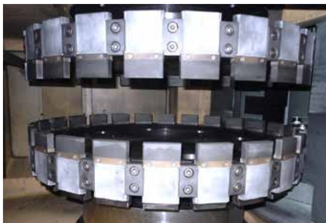
共计48段CBN或金刚石(每个砂轮24段)